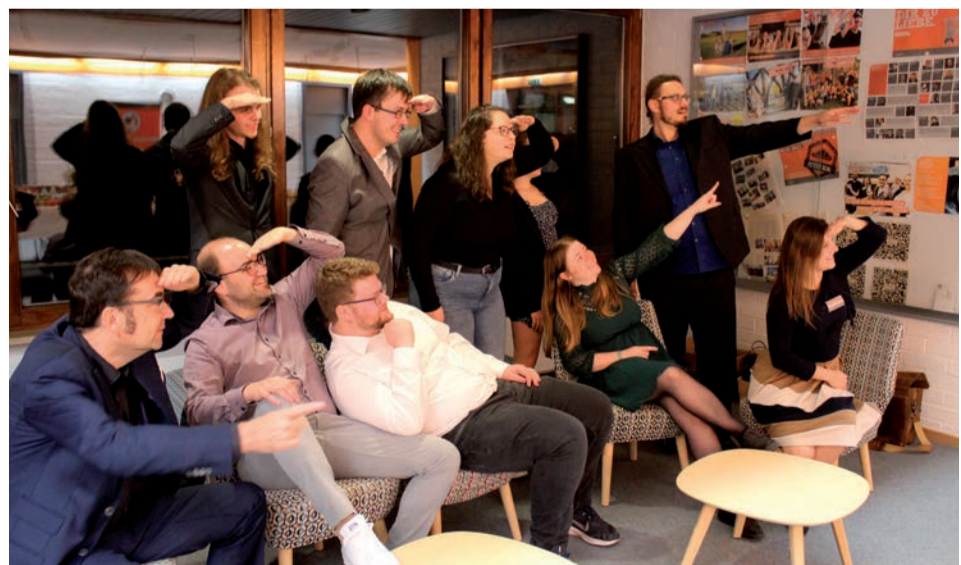
„Straßen? Wo wir hinfahren, brauchen wir keine Straßen.“ (Doc Brown). Die Evangelische Landjugend geht ihren eigenen Weg, der Landesvorstand zeigt die Richtung.