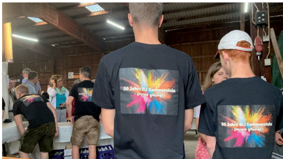
Auf die nächsten 50: Die ELJ Kammerstein ist jung geblieben.

Denn die Gruppe findet, die ELJ Kammerstein bleibt „Forever Young!“ weil immer