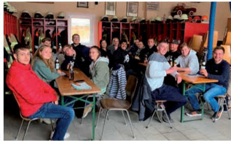
Lässt nichts anbrennen: die ELJ Keidenzell traf sich im Feuerwehrhaus

Birgit kommt auch gerne zu euch! Ihr erreicht sie unter birgit.bruckner@elj.de und 0170 4061799