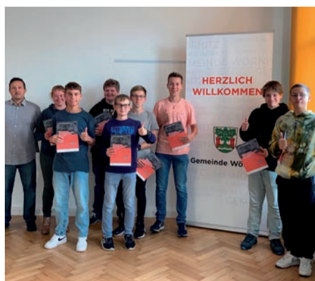
Beitrittserklärungen frisch ausgefüllt: Die ELJ Wörnitz wird wiederbelebt.