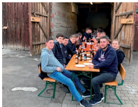
Die Vorstandschaffen der Ortsgruppen wurden vom KV Rothenburg mit Pizza und Cocktails belohnt.

Wunderbar, dass es solche Abende wieder geben kann!