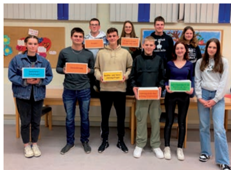
Wieder #miteinandermehr machen will die neue ELJ-Ortsgruppe in Lohr