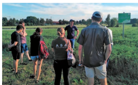
Mit dem ASA im Lupinenfeld: Exkursion im Rahmen des ELJ-Jahresthemas „Sei ein Trendsetter: Change your Lifestyle - Save the Planet!“

Abgeschlossen wurde die Führung mit einem kühlen Getränk. Die Exkursion fand statt im Rahmen des ELJ-Jahresthemas „Sei ein Trendsetter: Change your Lifestyle - Save the Planet!“