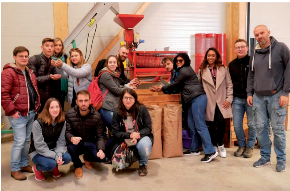
Die Teilnehmer der brasilianisch-deutschen Jugendbegegnung holen sich Einblicke in den Anbau und Handel von Haselnüssen bei der Firma Rieser Nuss in Oettingen.

Die Jugendlichen hatten sich von Anfang an blendend verstanden und freuen sich schon jetzt auf den Gegenbesuch in Brasilien im nächsten Jahr. Der Jugendaustausch wird von Engagement Global mit Mitteln des Bundesministeriums für wirtschaftliche Entwicklung und Zusammenarbeit gefördert.